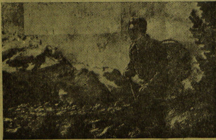
Альпинист в пути.

В нашем городе организуются пионерские группы или, как их еще называют, тимуровские команды. Они помогут семьям погибших защитников Родины, а также инвалидам войны и труда во всех их летних хозяйственных делах.